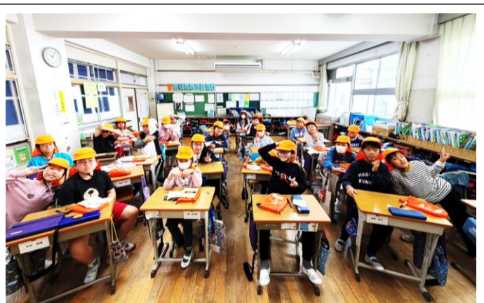
防災キャップを装着した5年生の様子

今後は災害時に備え、防災キャップをすぐに活用できるよう指導してまいります。 ※右写真は5年生