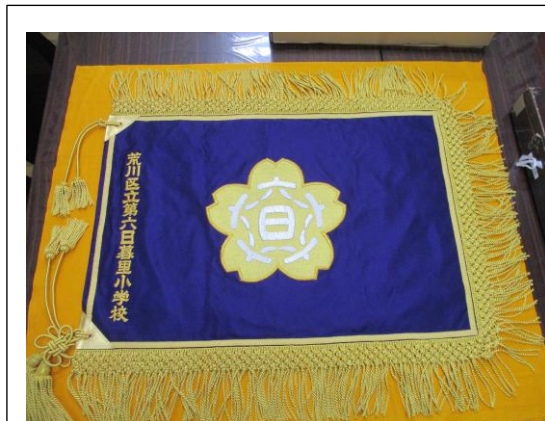
百周年を記念して新調された校旗