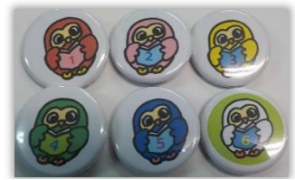
すいせん図書を読んで缶バッジをもらおう！