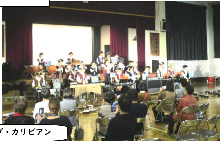
三味線 de パイレーツ・オブ・カリビアン