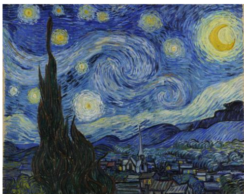
鑑賞した作品の1つ、ゴッホの「星月夜」