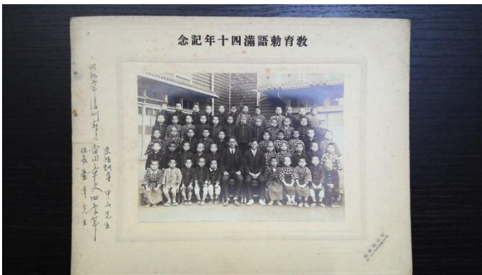
念記年十四滿語勅育教