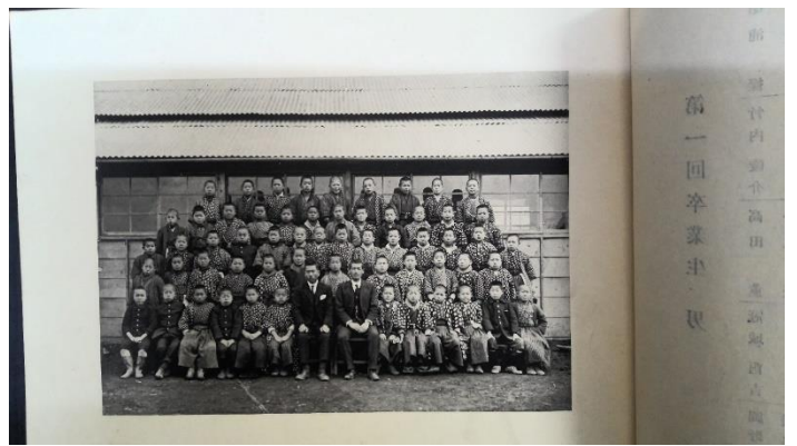
第 一 回 卒 業 式