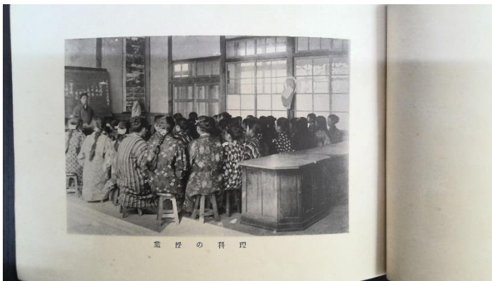
業 授 の 科 理