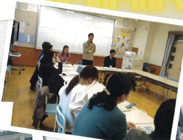
定例実行委委員会