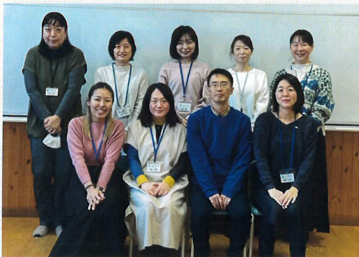
執行部のメンバーの皆さん