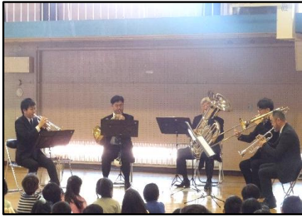
【室内楽演奏会（金管楽器）】