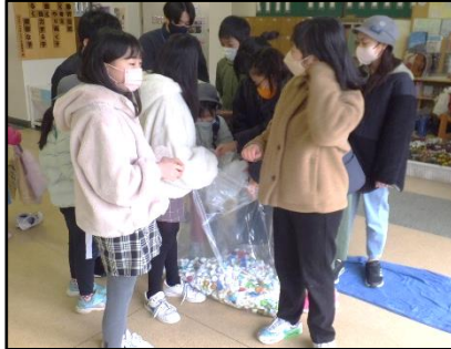
【ペットボトルキャップ回収（代表委員会）】