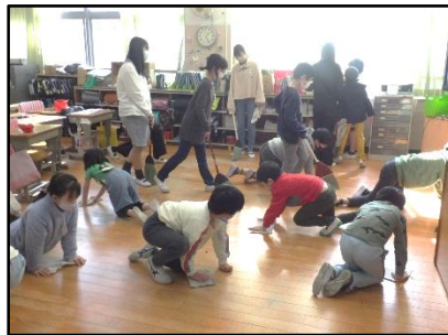
【学校をきれいにしたい！（縦割り班清掃活動）】