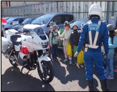
【荒川警察署見学（3年）】