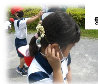
シロツメクサで 髪飾りを作ったよ!