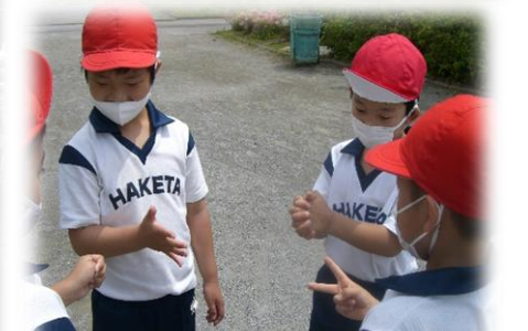
おにごっこやろう♪