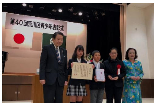
11月23日の学芸会終了後に、サンパール荒川で、金管活動に対して荒川区青少年表彰を受けました。