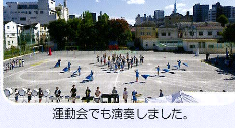
運動会でも演奏しました。

地域の行事に参加 地域の南千住なかよしまつりや社明パレード、ジョイフル三の輪パレードなど、地域の行事に積極的に参加し、交流を深めています。地域の皆様からは温かい応援をいただいております。