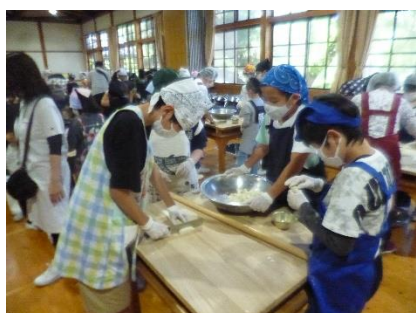
ほうとう作り体験

5月29日から2泊3日で山梨県の清里に行ってきました。雨天バージョンも入りつつ、予定通りの活動を実施することができました。「自分と友達がともにかがやこう！」を目的の一つにして、生活班と行動班を中心にそれぞれの係活動で友達と協力することを学びました。家族や学校の支援、施設の方々の協力に対して感謝の気持ちを持ち、その気持ちを伝えるためにしっかり声を出して表現することもがんばりました。素直な心で一生懸命に取り組むことができる5年生！この体験を生かした今後の成長が楽しみです。