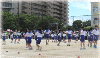
1年 とりこにさせるよ♡ アララカタブラツルリンコ

6月4日、雲一つない青空のもと令和5年度の運動会が行われました。今年はコロナ禍の制限がなくなり、4年ぶりに「いつも通りの運動会」となり、多くの保護者の方々が参観され、大盛況となりました。温かいご声援ありがとうございました。今年のスローガンは、「たった一回の大舞台 心を燃やし 勝利の道をつきすすめ」。子供たち一人一人の頑張り、大舞台での輝きがたくさん見られ、素敵な思い出となる素晴らしい運動会となりました。ご感想の提出にもご協力いただきありがとうございました。来年度に生かせるようにしていきたいと思ひます。