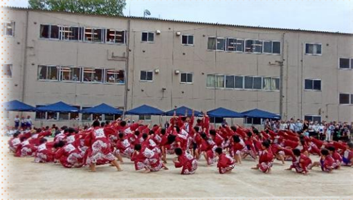
6年 「飛翔」~そして未来へ~