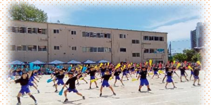
3年 サン! SUN! マスター☆