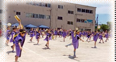
5年 沖縄民舞~ちゅーさるちむ~