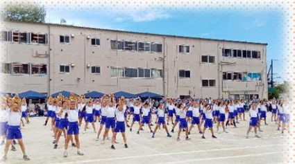
4年 One for all 4年は最強!!!!