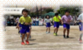
2年 パワフル!カラフル!ピースフル!