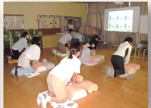
教職員の「心肺蘇生法」の研修