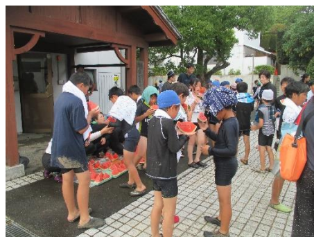
遊泳後にすいかを食べる子供たち

そして、次の想定外のことが起こります。それは、天気です。なんと、伊豆急下田駅に到着の大雨から一転、宿舎到着時には雨がやみ、海で遊泳することができたのです。さらに、雨予報だった2日目も、午前も午後も遊泳し、夕方は花火、星空を見ることができました。海は、波が高かったけれども、それが子供たちにはスリル満点！教員の背より高い波が来ると歓声があがり、ジャンプして波と戯れることができました。「まだ、やりたい！」「もっと、大きな波来い！」「楽しい！」と大満足の子供たちでした。全日程雨だと思っていたのに、海で、思う存分、遊泳が楽しめたこと、驚きです。