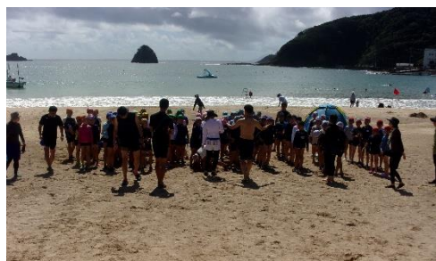
遊泳前に説明を受ける子供たち

台風や交通機関に翻弄されるところから始まった下田臨海学園は、終わってみれば、ほぼ計画通り実施でき、「楽しかった！」という思い出が残るものとなりました。一人一人が、自分の役割を全うし、ルールを守り、友達を思いやることができた2泊3日でした。子供たちは、日を追うごとに目に見えて成長しました。下田臨海学園のこの経験を生かして、2学期からも、目標に向かっていく力を発揮できるよう励ましていきたいと思えます。