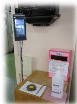
サーモカメラ導入しました！

ご家庭におかれましても引き続き、感染拡大防止にご理解・ご協力いただきますようよろしくお願いいたします。