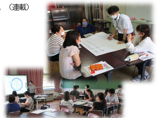
<夏休み中の教員研修の様子>