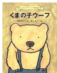
『くまの子ウーフ』神沢利子 作 ポプラ社