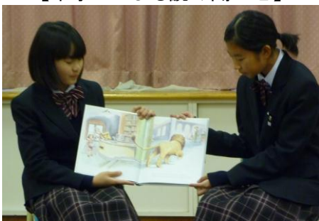
尾久地区読書活動活性化モデル校の取組

▼第七中学校生が、学童・こにこスクールの児童を対象に、絵本の読み聞かせを行っている。