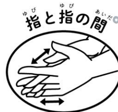
両手の指を組み合わせてこする