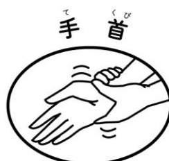
もう片方の手でつかんでねじる