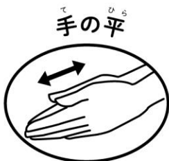
両方の手の平をこすり合わせる