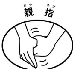
もう片方の手で包んでねじる