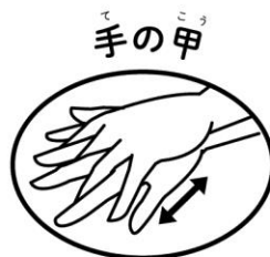
手の甲と手の平をこすり合わせる