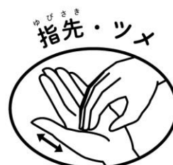
もう片方の手の平にこすりつける