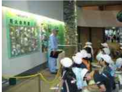
左：水道歴史館 右：中央防波堤資料館