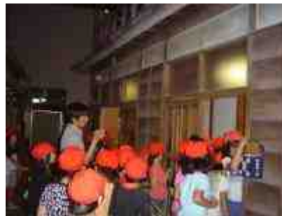
左：区議会議場 右：荒川ふるさと文化館