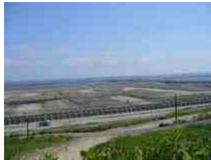
中央防波堤埋立地