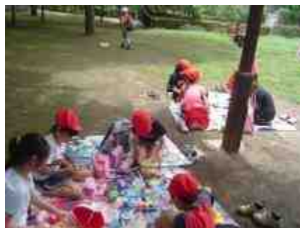
左：荒川遊園 右：諏訪台から