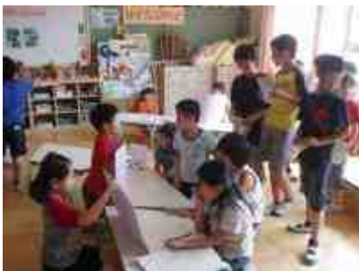
2年3組 なぞなぞのへや