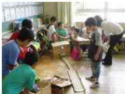
3年1組 ゲームランド