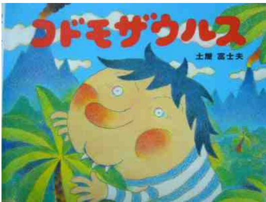
電子絵本にした本