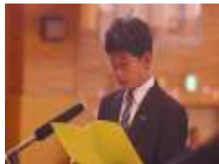
(始業式・決意を新たに)